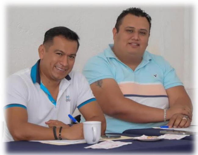
SECRETARÍA EJECUTIVA, ADMINISTRATIVA Y DE PROTECCIÓN CIUDADANA